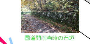
国道開削当時の石垣