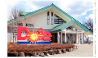
ドールランド みなかみ （フルーツランド 桃李館） TEL 0278-64-2800