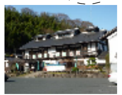
『太助の郷』 TEL 0278-64-1166

◇ナビ検索 恋越親水公園には電話が設置して有りませんので、『電話番号』による検索は出来ません。 『施設名称（恋越親水公園又は恋越公園）』でも検索出来ない場合、下記の地番で検索すると施設付近が表示されると思われます。 住所：群馬県利根郡みなかみ町西峰須川（ニミネスカリ）1727番地